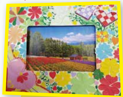
5A 簡泓浚 相架