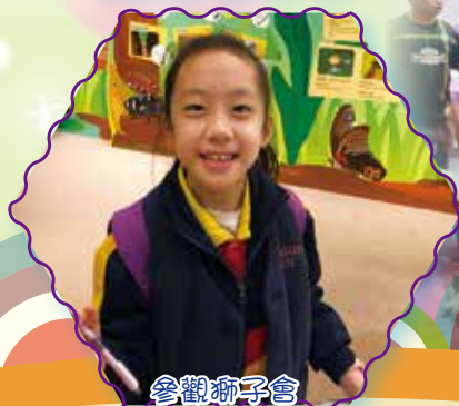
參觀獅子會 自然教育中心