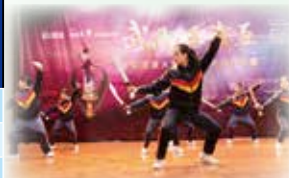
習練傳統武術，傳承尚武精神