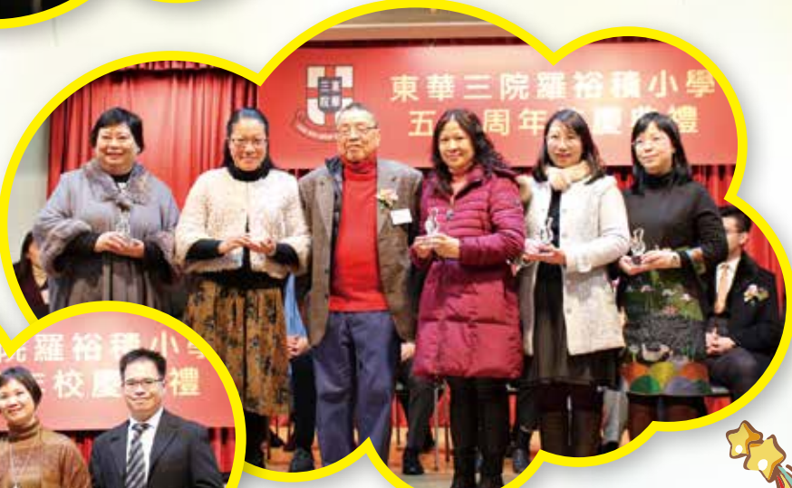
教職員喜獲頒發長期服務獎