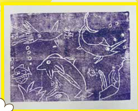
5C 陳皓鑫 海洋生物版畫