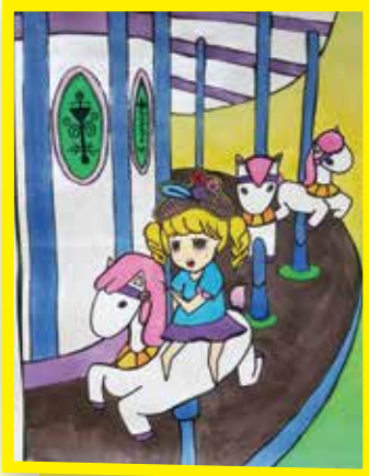
6A 李樂珊 聯想畫