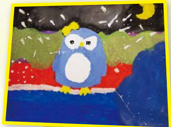
4C 冼柔雪 聯想畫