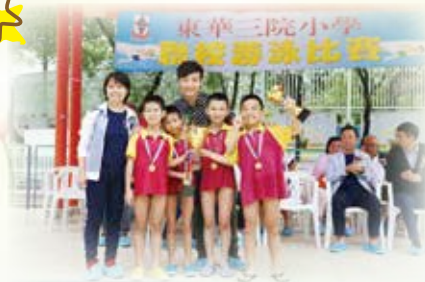
男丙憑實力奪得了自由泳接力冠軍、全場總冠軍，得以和主禮嘉賓方力申合照留念。