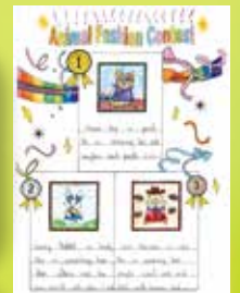
3B Lei Wing Kiu