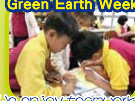
We enjoy teamwork.