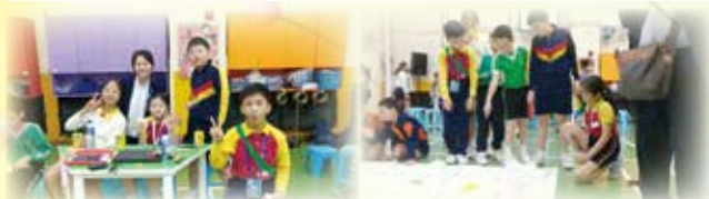
校長到場支持參賽學生