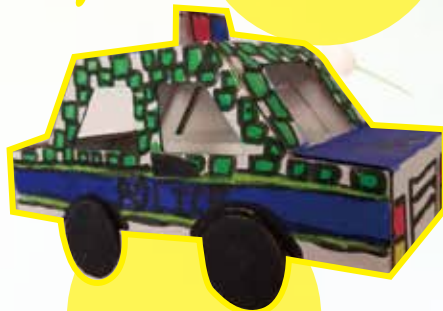
3B 許柏軒 車子