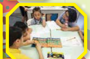
We enjoy the reading time.