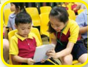
Revisit the high frequency words