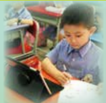
We write a story about Science Museum.