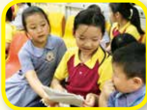
Can you read this word?