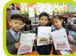
We love cakes.