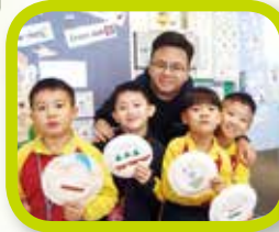
Look at our masks!