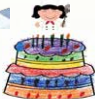
1D To Ting