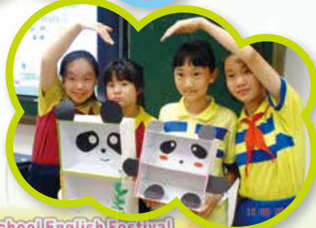
The Fengxiang Primary School English Festival