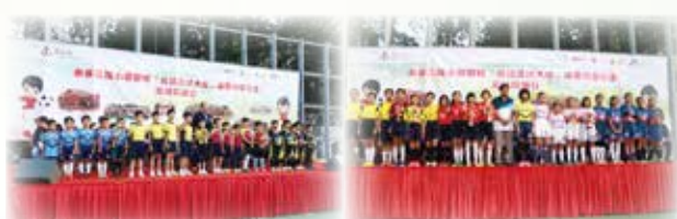
小一和小二同學組成的初級組足球員經過多場的運仗後，以眼淚和汗水換來冠軍，值得記念。