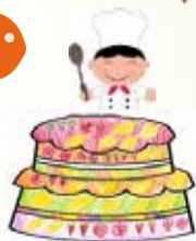
1D Chen Ruoxi