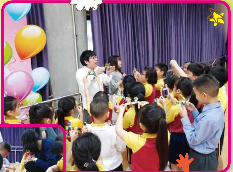
日本藝術家到校教授傳統手工