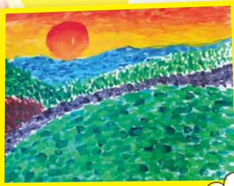
5B 譚夕蕎 黃昏