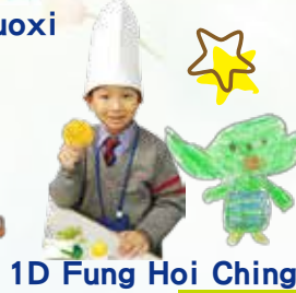
1D Fung Hoi Ching