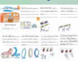
2C Chan Wun Tung