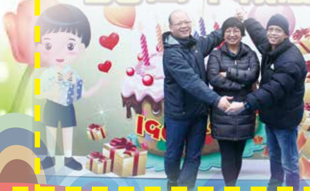
多位前校長、教員及校友齊聚一堂