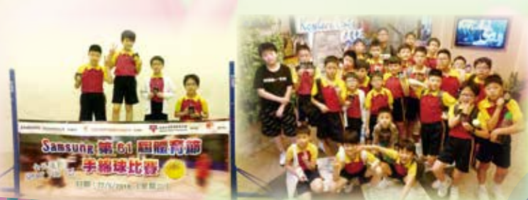
同學們在單打遺才賽中囊括所有獎項，真厲害！