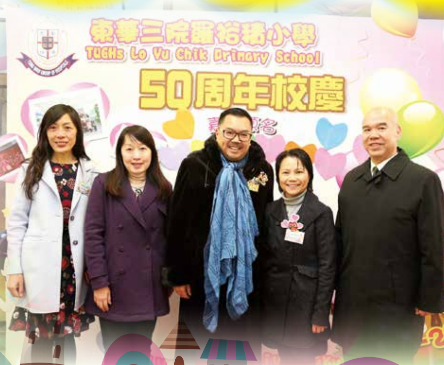
（至校長於金禧校慶典禮與丁酉年東華三院主席李鑒麟博士太平紳士、東華三院教育科學務主任及友校校長合影）