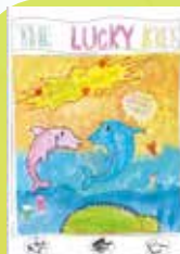
3B Yu Sum Yuet