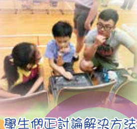
學生們正討論解決方法