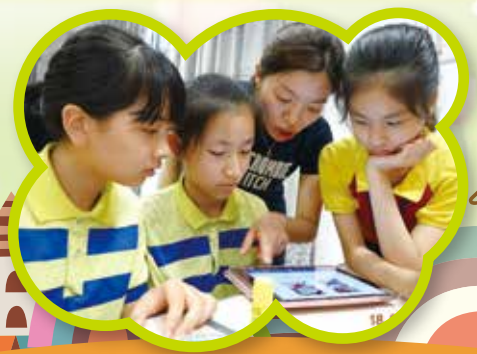
學生英語學習交流