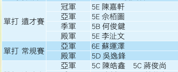
同學們在單打遺才賽中囊括所有獎項，真厲害！