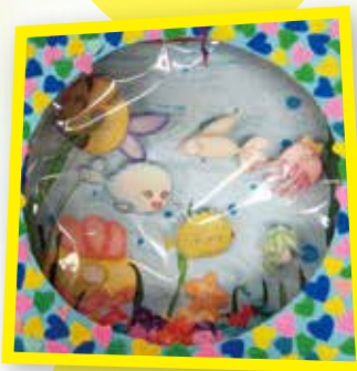
2D 蔡紫妍 海洋生物掛飾