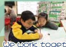
We work together.