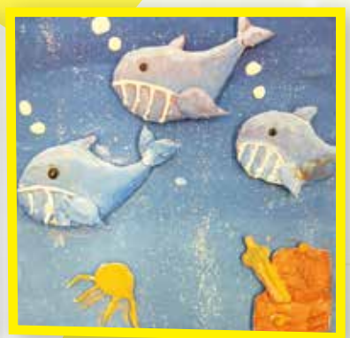
6E 盧文倩 海洋生物浮雕