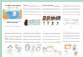
2C Lo Blogman