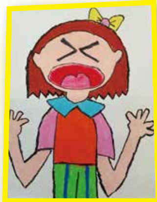
4D 葉可盈 吶喊