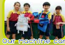
Our machine can save the Earth.