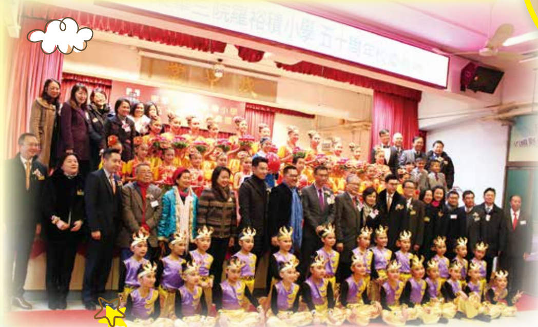
東華三院 2017/2018 董事局