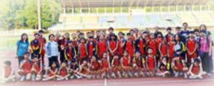
在聯校運動會後，運動員們與校長、老師們合照。