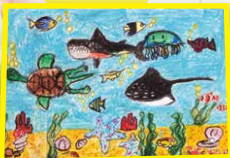
2D 陳卓建 美麗的海底